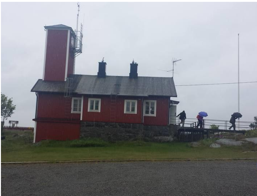
Lotshuset på Järnäsklubb, besöket skedde mitt under ett skyfall

Under resan söderut mot Nordmaling guidade naturgeologen Jan Åberg oss genom att berätta om naturen i Västerbotten och dess historia från senaste istid och framåt illustrerat med hjälp av exempel längs E4:an.